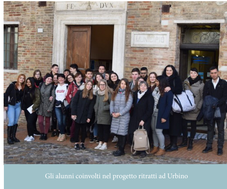
Gli alunni coinvolti nel progetto ritratti ad Urbino