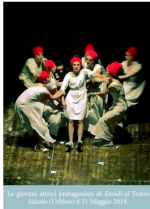
Le giovani attrici protagoniste di Eroidi al Teatro Sanzio (Urbino) il 31 Maggio 2018.