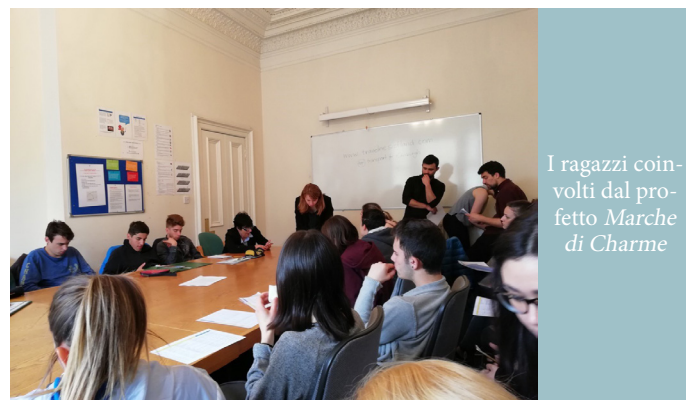
I ragazzi coinvolti dal progetto Marche di Charme

adeguatamente con corsi di lingua, e incontri formativi che serviranno ad attutire l'impatto sui giovani studenti con la nuova realtà immersiva che si troveranno a vivere per 5 settimane. Al termine dell'esperienza di mobilità gli studenti riceveranno l'Europass mobility e si troveranno ancora protagonisti nel lavoro di disseminazione.